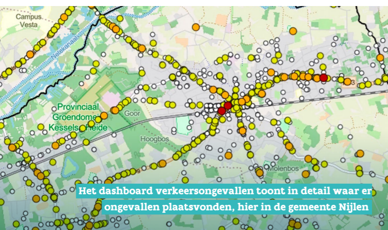
Het dashboard verkeersongevallen toont in detail waar er ongevallen plaatsvonden, hier in de gemeente Nijlen

Met het traject Verkeersveilige Gemeente ondersteunt en begeleidt de provincie Antwerpen de lokale besturen op weg naar nul verkeersdoden. Bijna alle Antwerpse lokale besturen maken gebruik van de succesformule.