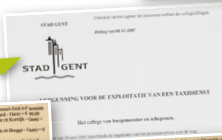
Algemene vergunning voor de exploitant

Het College keurt de aanvraag goed: de bevoegde ambtenaar voegt de voertuiggegevens en tariefafspraken in in Centaurus. Het systeem verzamelt alle gegevens en maakt de printklare documenten op.