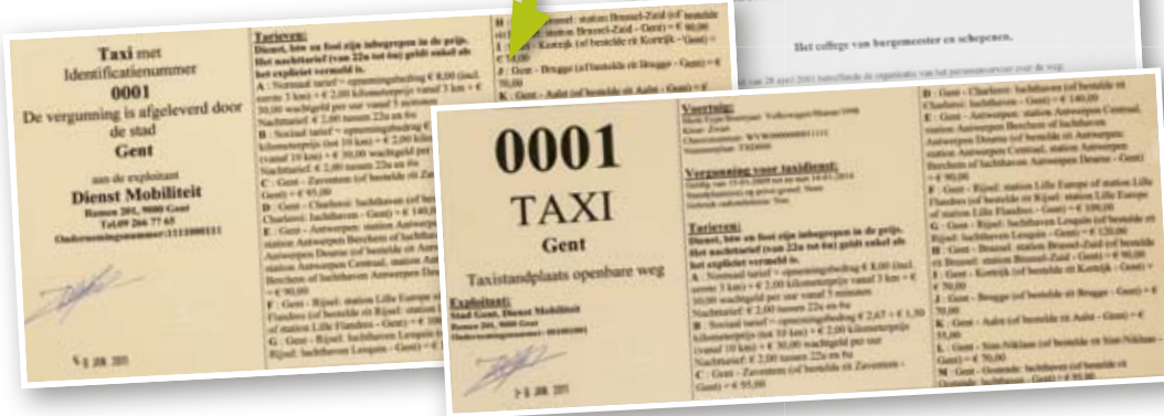
2 taxikaarten per voertuig met de tarieven: