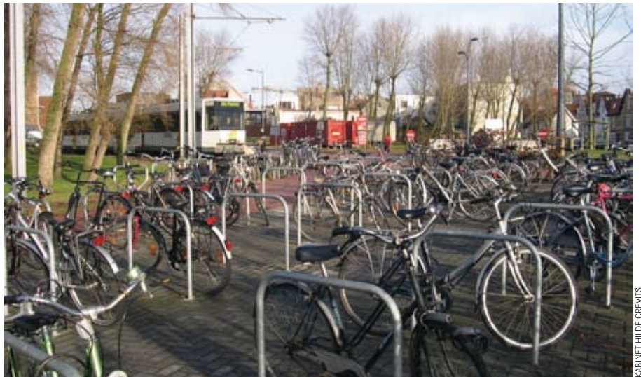
KABINET HILDE CREVITS

“Het is belangrijk dat mensen vlot kunnen overstappen van het ene vervoermiddel naar het andere. Om het gebruik van het openbaarvervoeraanbod te optimaliseren, moeten alle weggebruikers vlot kunnen overstappen. De fiets als voor- en natransport van het openbaar vervoer is een goede combinatie. Daarom heb ik in de net afgesloten beheersovereenkomst met De Lijn expliciet de comodaliteit fiets en openbaar vervoer opgenomen. Dit gebeurde voor het eerst. Tegen 2015 moet