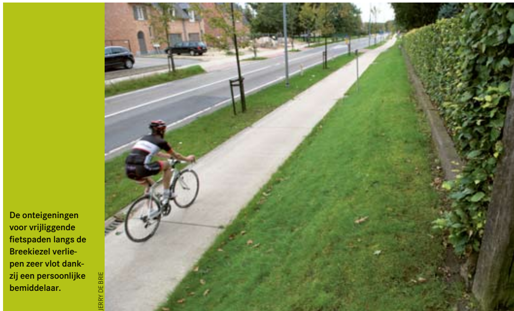
De onteigeningen voor vrijliggende fietspaden langs de Breekiezel verliepen zeer vlot dankzij een persoonlijke bemiddelaar.

Sinds vorig jaar gaat de gemeente nog een stapje verder. "Volgens nieuwe afspraken met