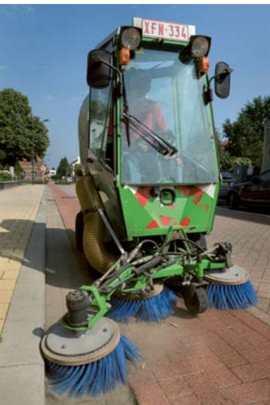
JERRY DE BRIE

Voor het onderhoud van de fietspaden kocht Mortsel de voorbije jaren twee gespecialiseerde toestellen aan: een Egholm van het type city ranger 2100 en 2200. Deze toestellen worden ingezet als veegwagens, voor het borstelen van onkruid, het maaien van het gazon en als sneeuwruimer en zoutstrooier.