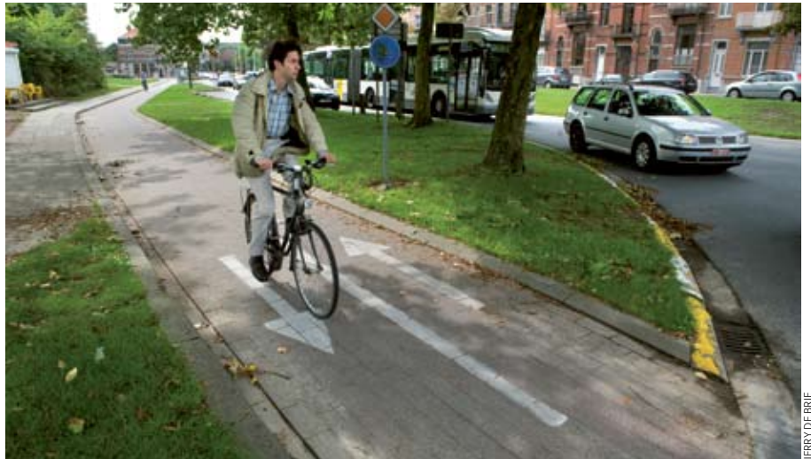
Herstellingen door nutsmaatschappijen worden in Leuven streng geëvalueerd en zo nodig opnieuw gedaan.

“Het was initieel niet gemakkelijk om dit systeem op poten te zetten, maar het werkt wel”, zegt Dirk Robbeets, schepen van mobiliteit in Leuven. “In het begin hadden we een waarborgfonds per werf, maar omwille van de administratieve rompslomp zijn we daar al snel van afgestapt. We werken nu met één grote waarborg per nutsmaatschappij. Bij betwistingen wordt die aangewend, en dat is al een paar keer gebeurd in het verleden.”