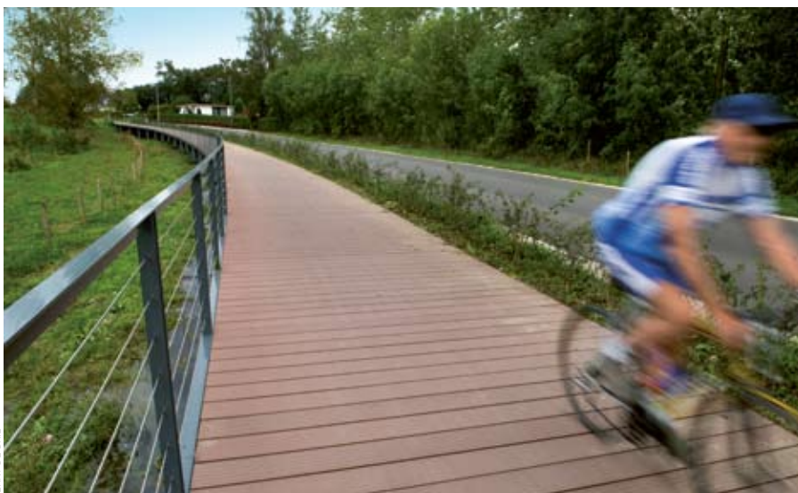
JERRY DE BRIE

80 % van de aanleg wordt gesubsidieerd via het Fietsfonds. Dat geld werd onder meer geïnvesteerd in fietsbruggen zoals deze op het traject.