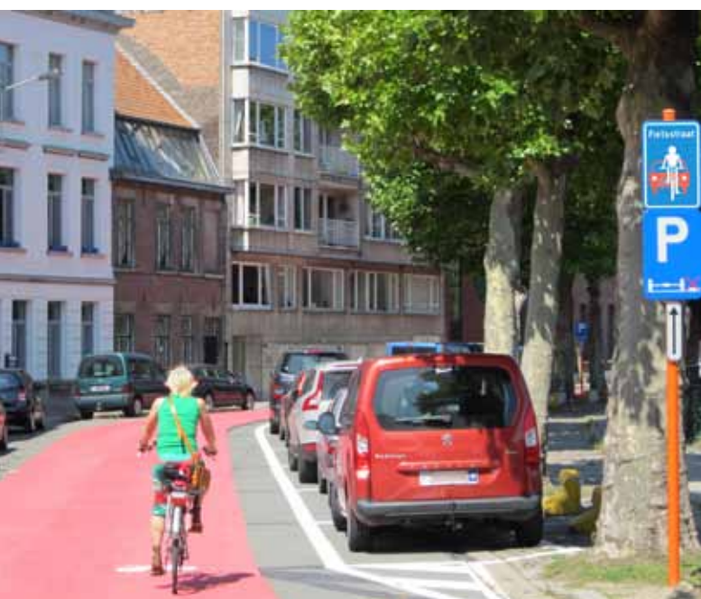
Ook fietsstraten worden gesubsidieerd.