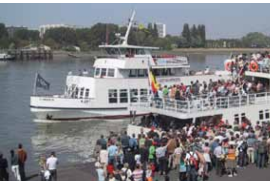
Op de dag van het evenement konden supporters gratis gebruik maken van de overzetboot tussen linker- en rechteroever.

Het parcours van de 10 miles en de marathon loopt door de het stadscentrum van Antwerpen, zowel op linker- als op rechteroever, onder meer via de Kennedytunnel, de Bolivartunnel en de Waaslandtunnel. De tunnels werden tijdelijk (soms beperkt) afgesloten voor verkeer. Tijdens de loopwedstrijd was het centrum van Antwerpen ook autoluw gemaakt tussen de Leien en de kaaien.