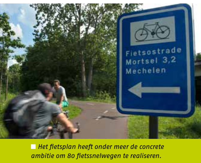
JERRY DE BRIE

■ Het fietsplan heeft onder meer de concrete ambitie om 80 fietssnelwegen te realiseren.