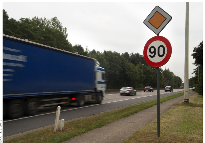
JERRY DE BRIE

■ Alle borden '70' (ook zonale) moeten in de loop van volgend jaar verwijderd worden op plaatsen waar 70 km/u de norm wordt. Hiervoor is geen aanvullend reglement nodig.