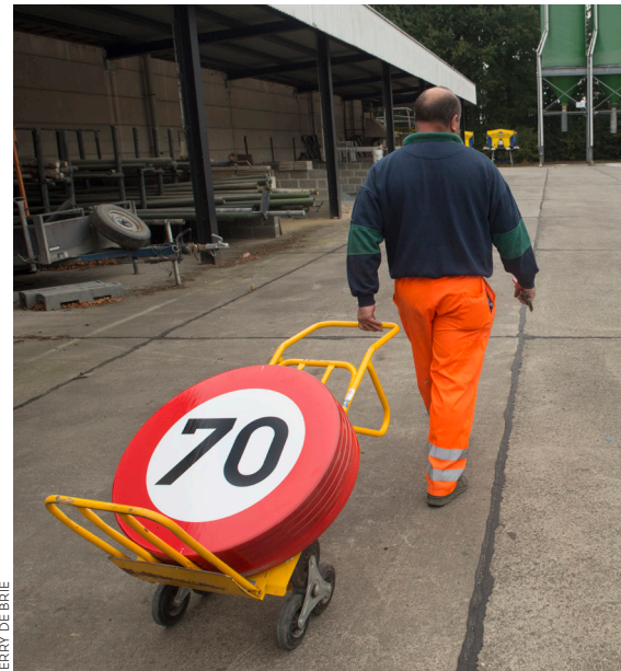
JERRY DE BRIE

De gewestwegen vallen onder het beheer van het AWV, het agentschap Wegen en Verkeer van de Vlaamse overheid. Hier hoeven lokale overheden dan ook geen acties te ondernemen. Het AWV zorgt zelf voor de verwijdering van de borden '70' en de eventuele plaatsing van nieuwe borden. In het voorjaar van 2016 toetste het