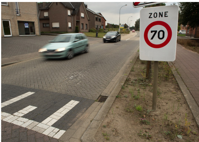
JERRY DE BRIE

AWV al met de gemeenten af welk snelheidsregime van toepassing zal zijn op de betrokken gewestwegen vanaf 1 januari 2017, op basis van de criteria in het dienstorder. Vanaf 1 oktober tot eind 2016 zorgt het AWV voor de opmaak van aanvullende besluiten en de plaatsing van borden C43 '90' op de locaties waar volgend jaar maximaal 90 km/u mag gereden worden. In de loop van de maand december zal het AWV de snelheidsinformatieborden aan de lands- en gewestgrenzen vervangen. In de loop van 2017 worden dan tot slot alle borden C43 '70' weggehaald.