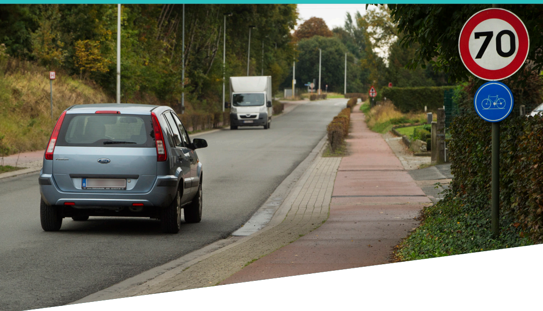
JERRY DE BRIE

Vanaf 2017 wijzigt de algemene snelheidsbeperking op de meeste Vlaamse wegen van 90 naar 70. De borden C43 '70' zullen op veel plaatsen weggehaald worden. De vereenvoudiging zal onder meer bijdragen tot meer verkeersveiligheid.