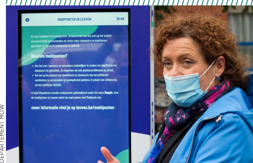
Lydia Peeters, Vlaams minister van Mobiliteit en Openbare Werken: "Deze legislatuur willen we meer dan 700 Hoppinpunten langs gemeentewegen realiseren."

en de toegankelijkheid van het mobipunt. Ook de omgeving speelt een rol: is er tewerkstelling en/of woongelegenheden in de buurt?"