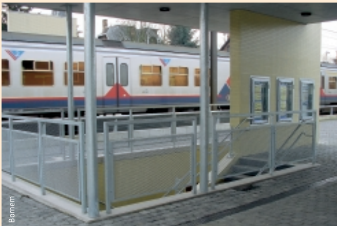
Voetgangerstunnel van de parking naar het perron: veilig en comfortabel.

De totale kosten werden geraamd op 2.683.807,89 euro. De NMBS neemt hiervan 1.673.616,40 euro voor haar rekening. De gemeente betaalt 972.576,19 euro en de overige kosten worden gedragen door De Lijn.