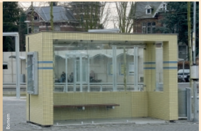
Aangepast straatmeubilair: comfortabele schuilhuisjes met een speciaal ontwerp en geïntegreerd in het geheel.