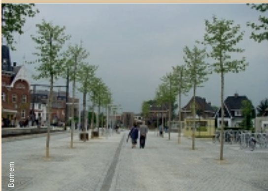
Een dubbele rij platanen zorgt voor rust, eenheid en geeft schaduw in de zomer.