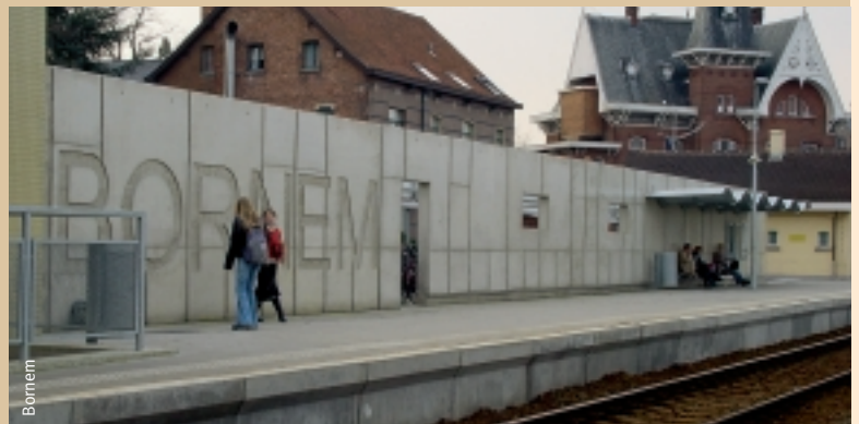
Het perron werd opgehoogd om het op- en afstappen te vergemakkelijken. De 'Bornem-muur' zorgt ervoor dat de wind tegengehouden wordt, wat wachten een heel stuk aangenamer maakt.