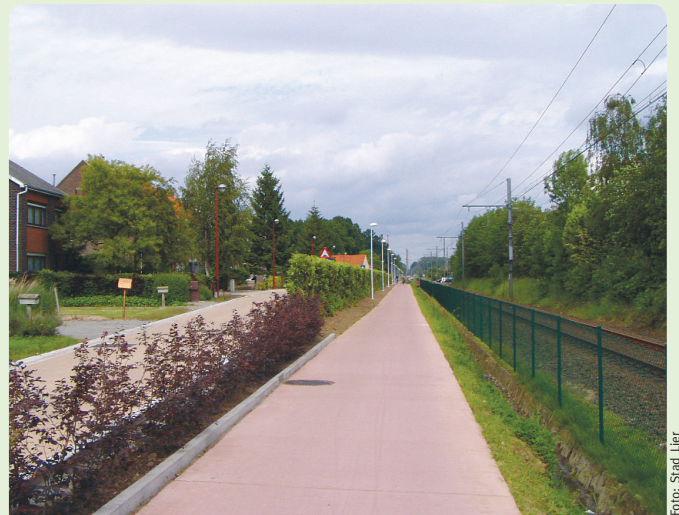
Van Lint naar Lier: een breed en verhoogd fietspad, afgescheiden door een haag.

“Elke provincie heeft een gedetailleerd reglement. De lokale overheid kan zelf initiatief nemen door contact op te nemen met de provincie. De provincie is verantwoordelijk voor het projectmanagement en de kwaliteitsbewaking van de projecten. Zij moedigt de gemeenten aan om het netwerk mee uit te bouwen en staat hen bij in de opmaak van de projectdossiers en bewaakt de procedurele opvolging.”